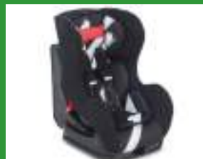
Автокресло группы I для детей массой 9-18 кг