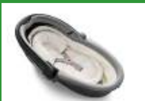
Автокресло «люлька» группы 0 для детей массой менее 10 кг

Детские удерживающие устройства подразделяют на 5 весовых групп: