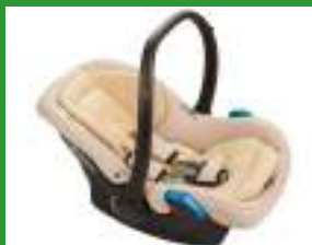
Автокресло группы 0+ для детей массой менее 13 кг