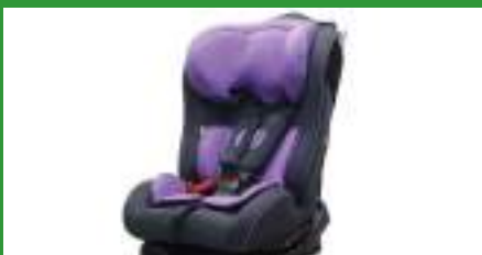
Автокресло группы II для детей массой 15-25 кг