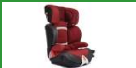
Автокресло группы III для детей массой 22-36 кг (возможно использование бустера)